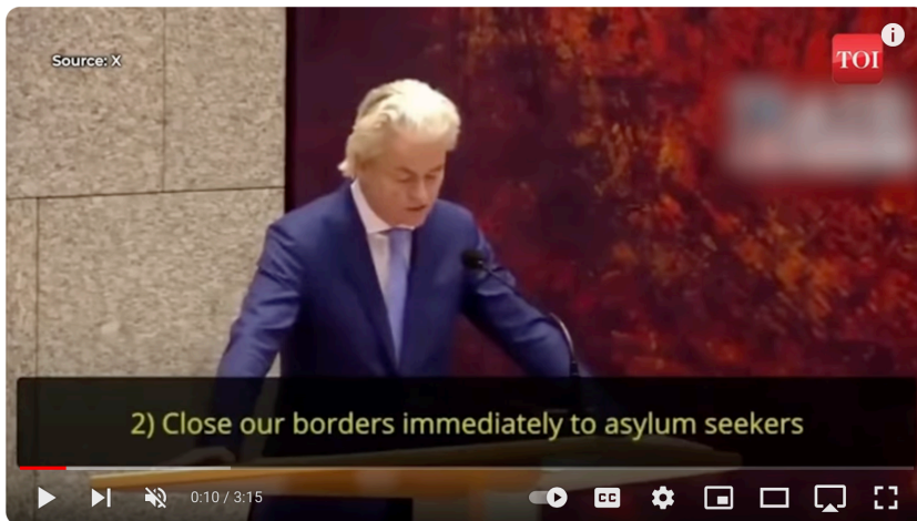
New Dutch PM's Message for Muslims | Geert Wilders is Anti-Islam, Anti-EU and Anti-Immigrant | Viral

این سخنرانی در ۱۷ ژوئیه ۲۰۲۴ به زبان هلندی ارائه شد و با ترجمه به انگلیسی در یوتیوب پخش گردید. برای دیدن اصل ویدیو در یوتیوب اسم Geert Wilders را جستجو کنید. ترجمه از سوسن لاری.