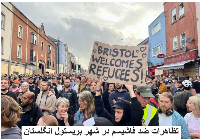
تظاهرات ضد فاشیسم در شهر بریستول انگلستان