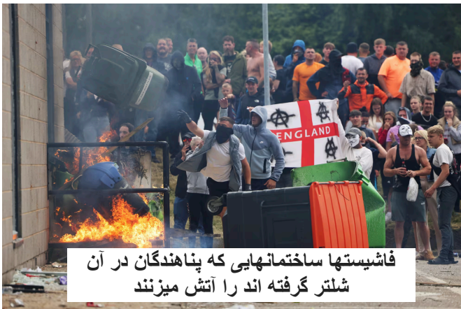
فاشیستها ساختمانهایی که پناهندگان در آن شلتر گرفته اند را آتش میزنند

و امروز وظیفه عقب راندن و شکست این جنبش ضد بشری تنها بر دوش طبقه کارگر و جنبش سوسیالیستی و رادیکال آن سنگینی می کند. طبقه ای که میتواند با قرار گرفتن در راس جنبشی عظیم که حی حاضر بر علیه نسل کشی در غزه در مقیاس بین المللی شکل گرفته، ضربات سنگینی را به این ارتجاع عریان سرمایه داری وارد کند.